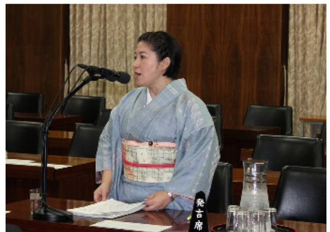
衆議院予算委員会第7分科会にて和装振興、 伝統産業振興について審議【2月26日】