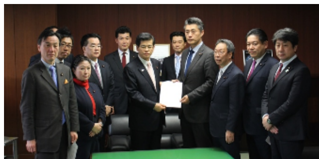
軽井沢バス転落事故を受けて、国土交通大臣に 再発防止策等を要請〔2月9日〕

多くの方に、ぜひ合理的な配慮を行い、障がいがある人もない人も共生できる環境についてお考えいただけたら幸いです。