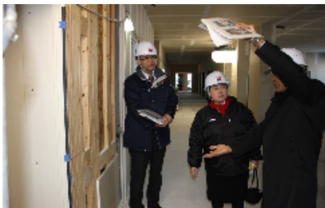
木造5階建特別養護老人ホーム建設現場視察 〔2月26日〕

5月には、日本国憲法が施行されて70年を迎えます。改めて、戦争のこと、平和について学んでいきたいと思えます。