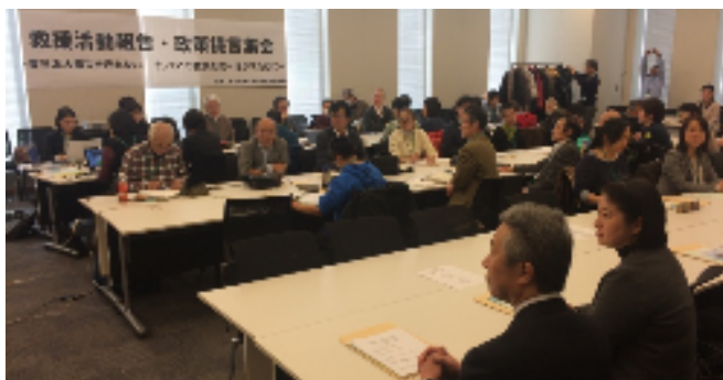
東北関東大震災障害者救援本部の 活動報告・政策提言集会に出席〔2月17日〕

法律では、国の機関、地方自治体、民間事業者に対し、不当な差別的対応を禁止した上で、合理的な配慮（その場で可能な配慮）を義務づけるものですが、法の趣旨を周知する